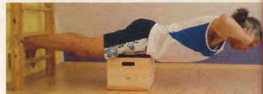
Arnold Wiegand beim zusätzlichen Muskeltraining

Ursprünglich komme ich aus dem Vertrieb im IT-Bereich. Später wechselte ich in den Personalbereich. 2006 machte ich mein Hobby